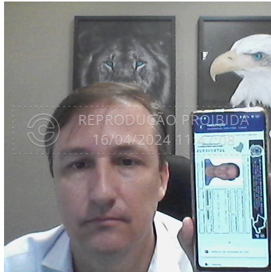
official_document_front_16 abr 2024, 11-47-08.png

Foto da frente do documento oficial com hash SHA256 prefixo fc241c(...)